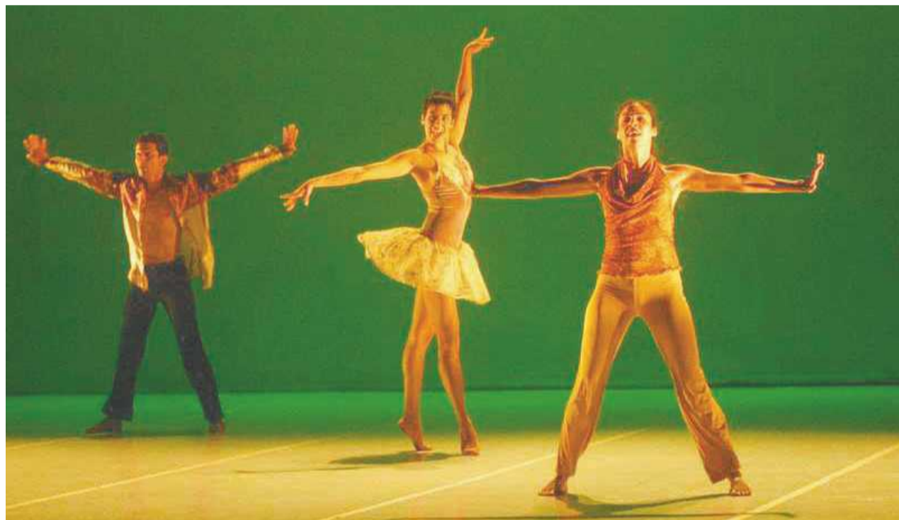
LUX BOREAL, GRUPO DE DANZA que en estos momentos se presenta en Zaragoza, España, también forma parte del MANIFIESTO.

"Estamos convencidos que no será con programas y campañas publicitarias huecas como se mejorará la imagen negativa de Tijuana hacia el exterior. Los tijuanaenses aceptamos sin prejuicio alguno el pasado y presente de una ciudad contrastante y multifacética, que ofrece